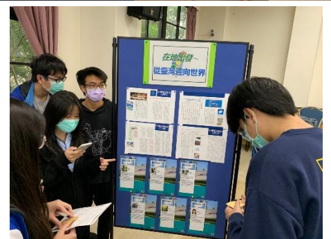
(北一區/板橋高中/小小外交官/2)