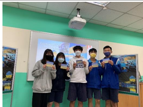
(北一區/板橋高中/小小外交官/1)