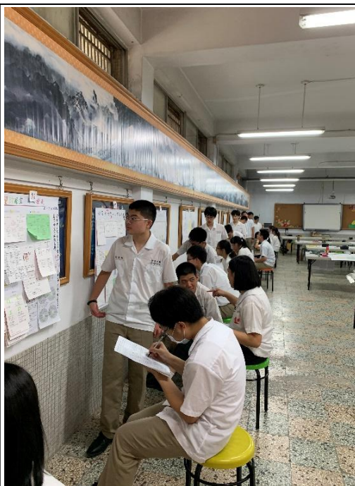
成果發表：世界咖啡館(發表人與評論 員採回合制)

(照片格式請用：區/學校名稱/ 課程名稱/照片編號，例如：北 一區/北大高中/三峽學/1)