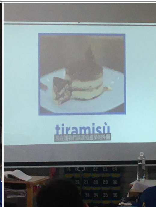
北三區/苗栗高中/歷史this way/2