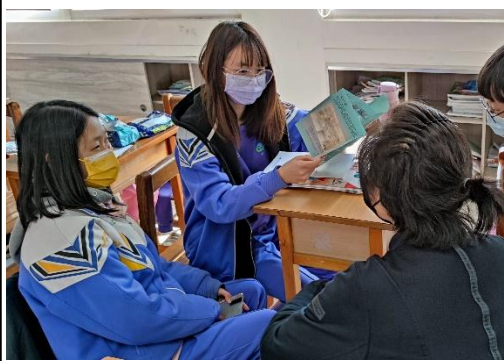
北一區/金山高中/社會與公民/1

(照片格式請用：區/學校名稱/課程名稱/照片編號，例如：北一區/北大高中/三峽學/1)